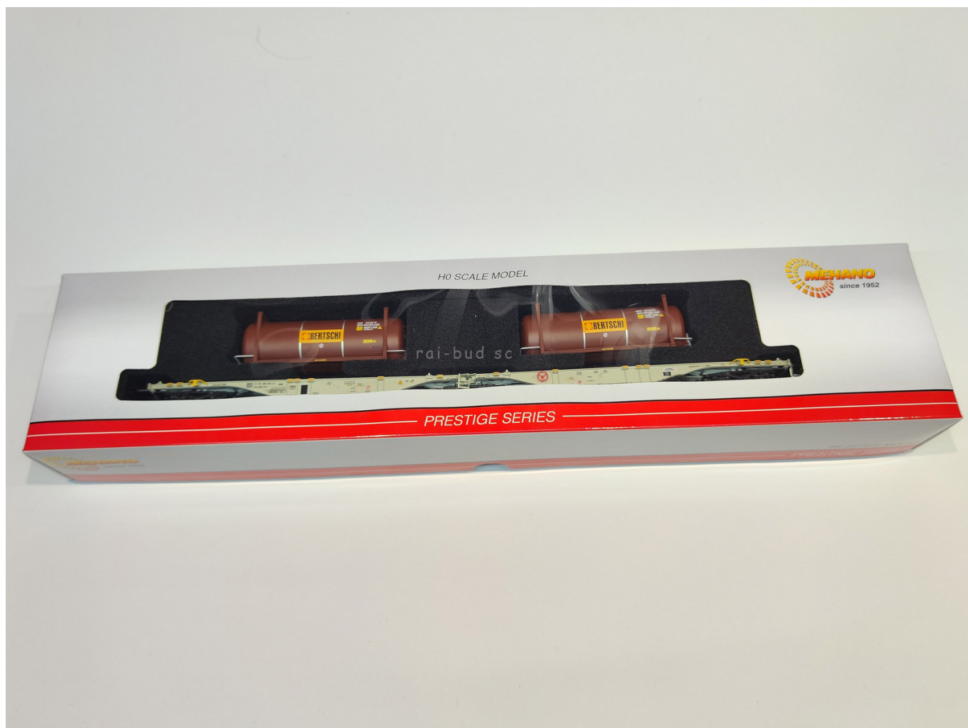
Model: laweta z kontenerem : WAGON LAWETA SGGMRSS CYSTERNA BERTSCHI HO 1:87 WAGON TOWAROWY